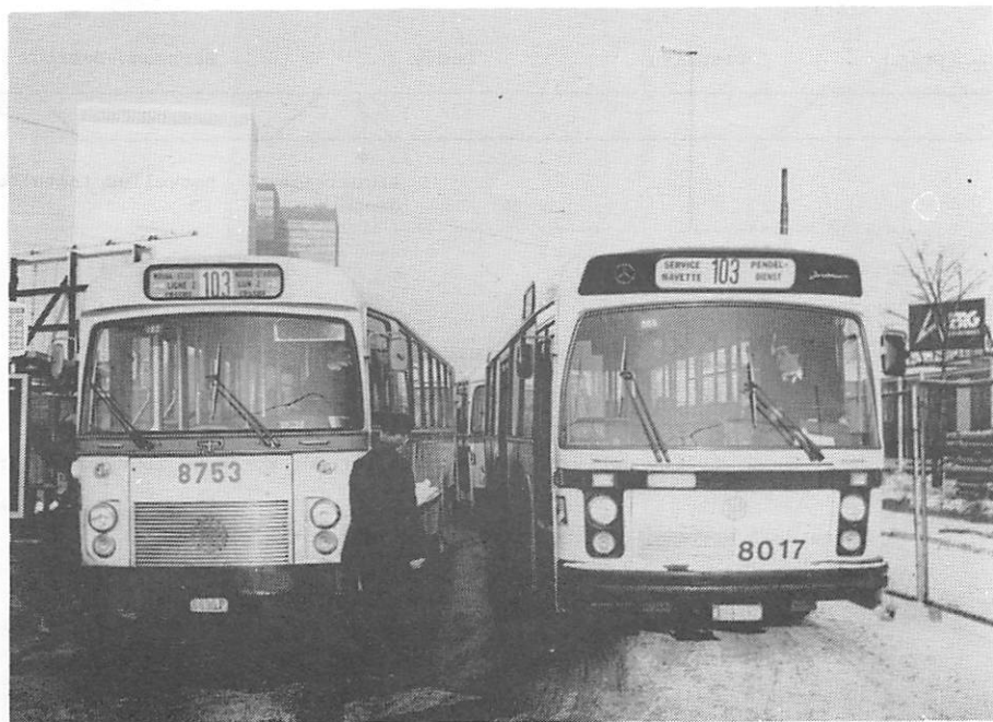
L'autobus 8017 sur la L.103 "Service navette" dépasse l'autobus 8753 avec film indicateur de parcours tram L.103 "Houba-Stade - M.Ligne 2 - H. Erasme" le 5 janvier 1985.