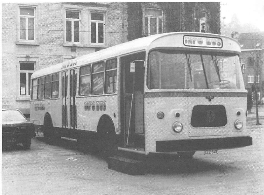
L'info bus (ex- 8403) place Bisschoffsheim le 19 mars 1985.