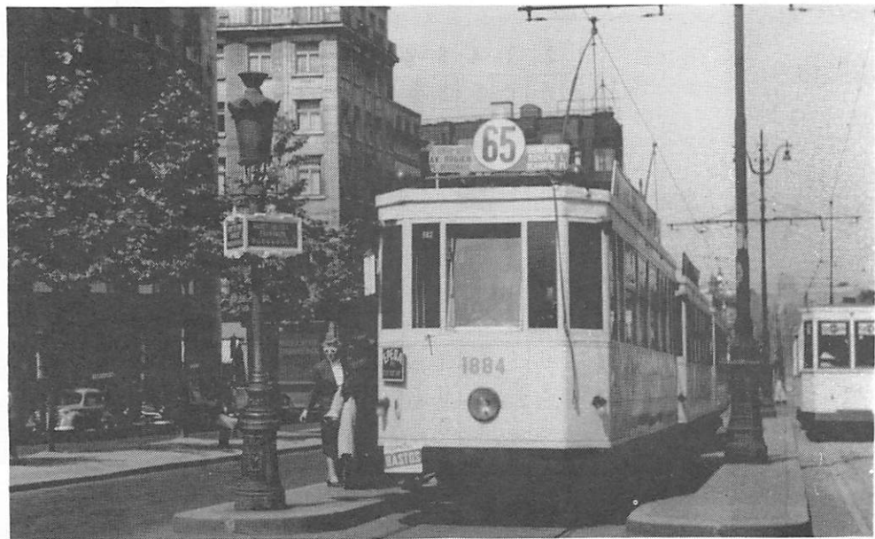
La motrice 1884 sur la L.65 "pl.Général Meiser - av.Rogier - pl.Béguinage" à l'arrêt avenue Galilée - porte de Schaerbeek vers l'av.Rogier le 1 juillet 1951.