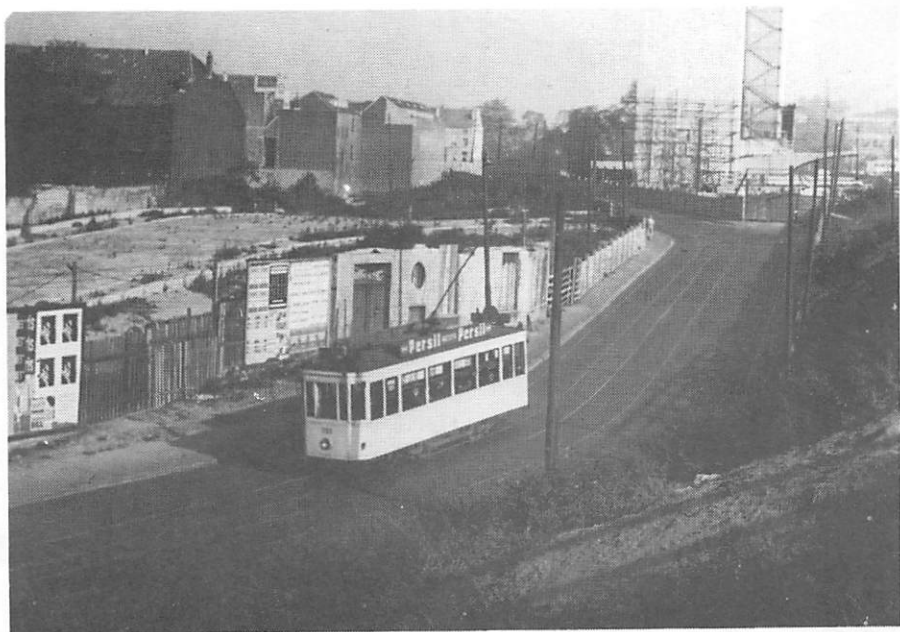
La motrice 1090 sur la L.66 "Evere r.A.De Boeck - av.L.Bertrand - pl.Béguinage" descend la rue de Schaerbeek vers le centre ville au mois d'avril 1953. (photo G.Desbarax).