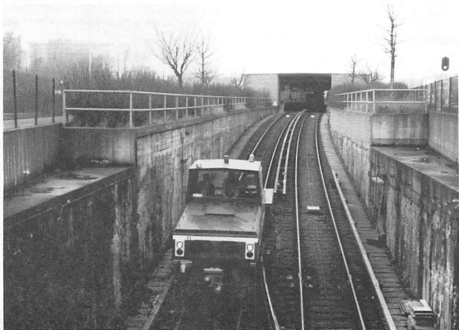
Le locotracteur électrique 65 s'engage sur la voie 1 vers Herrmann-Debroux en arrière-gare Demey et passe sur l'aiguillage qui sera démonté quelques jours plus tard. Ce locotracteur tire un wagonnet pour le rodage du 3ème rail. 27 janvier 1985.