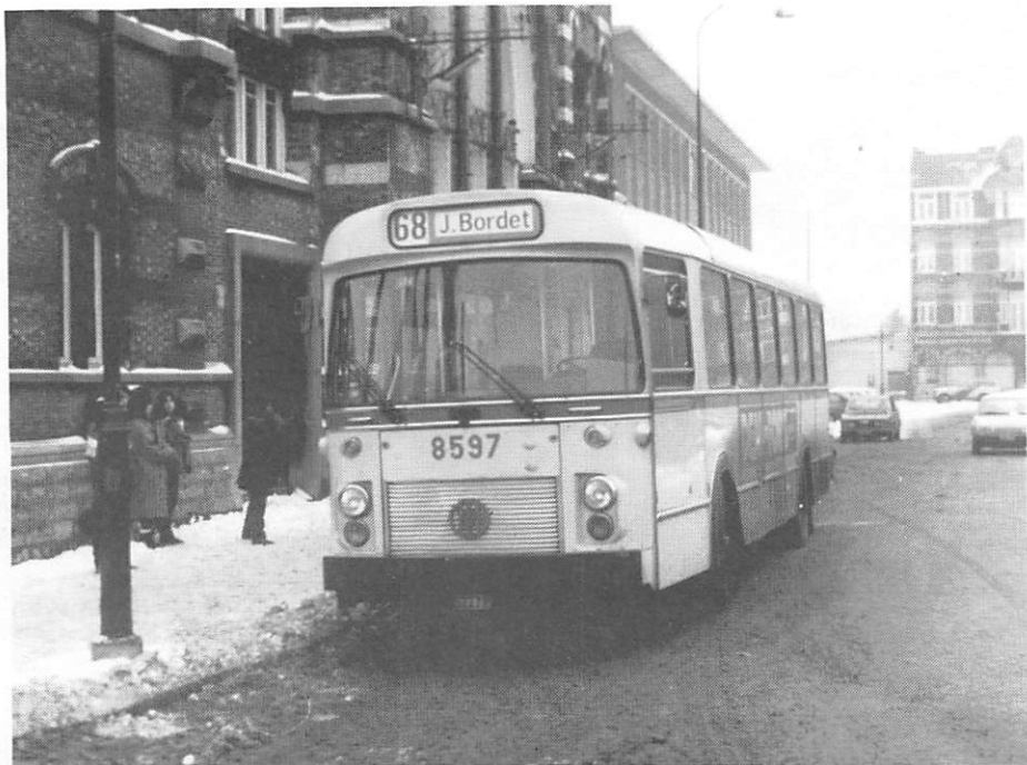
L'autobus 8597 sur la L.68 "J.BORDET" à l'arrivée Gare de Schaerbeek le 11 janvier 1985.