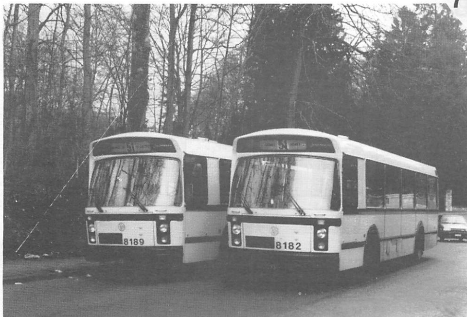
Dépassement de l'autobus 8189 sur la L.51 "CALEVOET B." par l'autobus 8182 sur L.51 barré "DEMEY" au terminus de Sainte-Anne le 14 mars 1985.