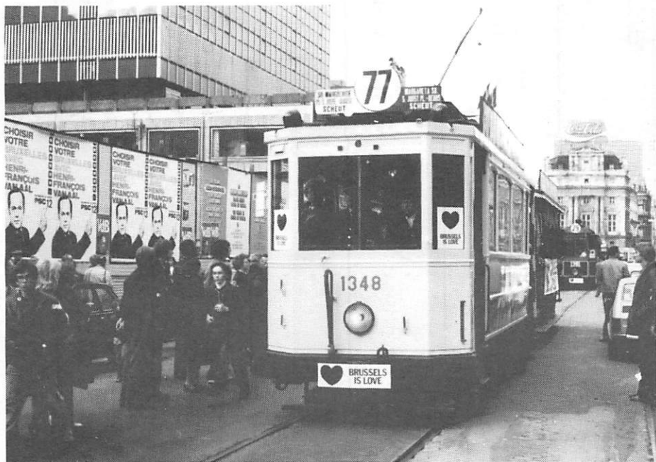
La motrice 1348 avec la baladeuse 29 du musée au cours du même cortège passe bd Anspach vers le Midi le 4 octobre 1976. Une petite idée de ce que sera le cortège du 21 juillet prochain.