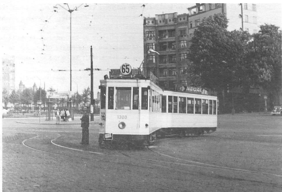
La motrice 1300 avec la remorque 2021 au terminus place Meiser de la ligne 65 "pl.Général Meiser - av.Rogier - pl.Béguinage" le 2 mai 1953. Le tram vient de la chaussée de Louvain (L.63) pour partir vers l'avenue Rogier.