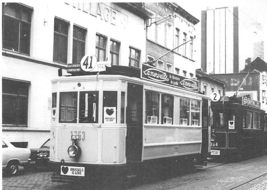
Les motrices 1753 et 984 du musée sont en attente chaussée d'Anvers pour le cortège historique consacrant la fin des tramways sur les boulevards du Centre le 4 octobre 1976.