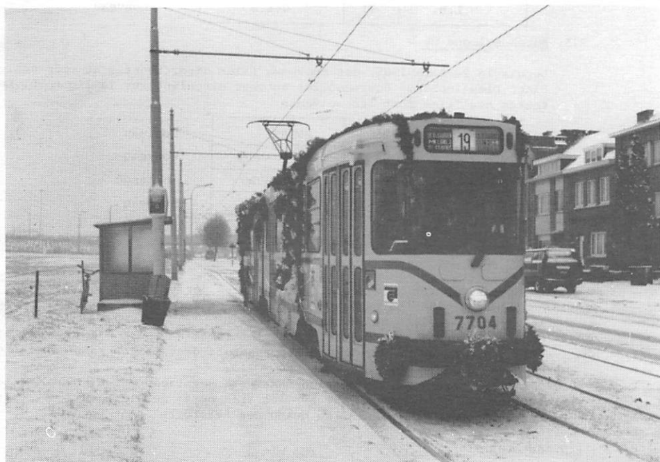
La motrice 7704 sur la L.19 "Gr.Bijgaarden - M.Ligne 2 - pl.St-Denis" au terminus de Groot-Bijgaarden (A.Dansaertlaan) le 9 février 1985.