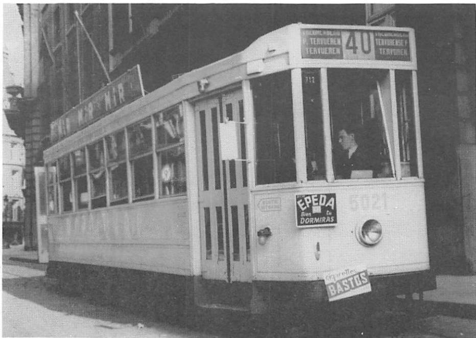
La motrice 5021 sur la ligne 40 "Treurenberg - p.Tervueren - Tervueren" en stationnement au terminus Treurenberg rue de Louvain le 1 juillet 1951.