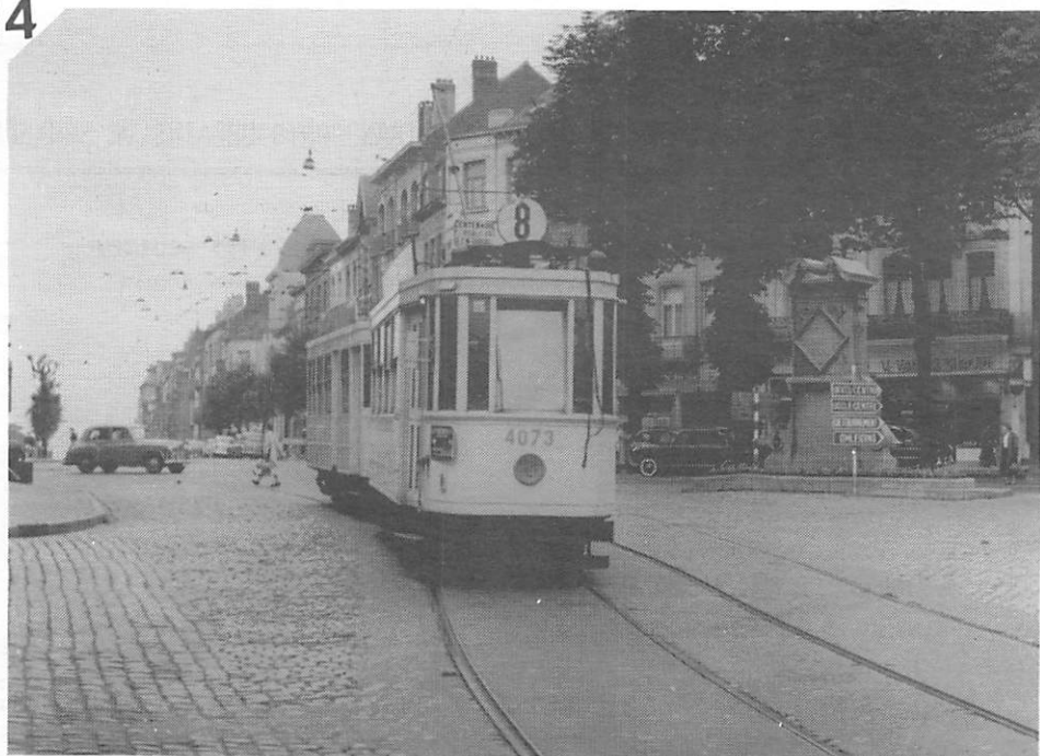
La motrice 4073 avec remorque sur la ligne 8 "Centenaire - pl.E.Bockstael - pl.Royale - .p.W.Churchill" à la place Vanderkindere vers la pl.Louise le 6 juillet 1956.